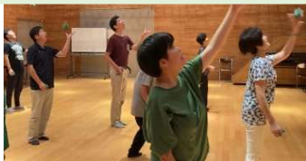
やりたいこと講座