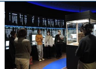
生涯学習プログラム「スープノアカデミア」 共生社会コンファレンスin仙台