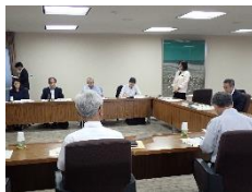
検討委員会の様子