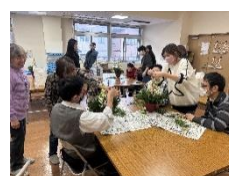
公民館での講座の様子