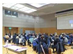
コンファレンスの様子